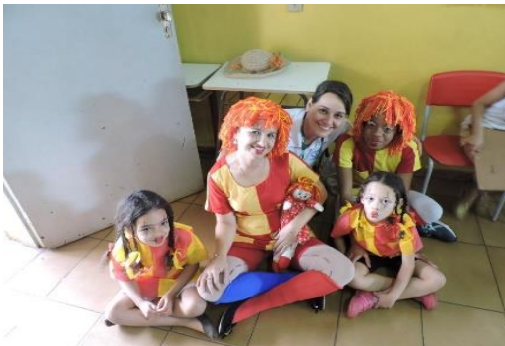
Figura 9 – Coordenadora da área da Pedagogia, pibidiana e crianças comemorando o dia do folclore na EMEFTI Prof. Waldyr Emerich Portilho