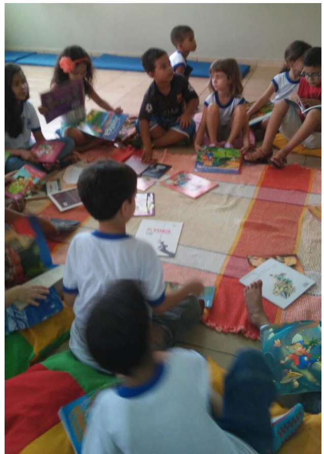
Figura 34. Pibidians desenvolvendo o projeto leitura na EMEF Prof. Selva Campos Monteiro