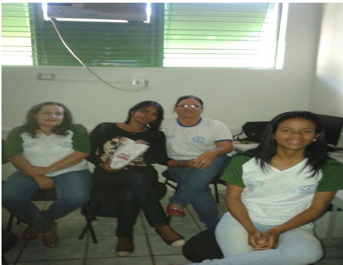
Figuras 54. Pibidianas da área da Pedagogia, equipe da EMEFTI Prof. Waldyr Emrich Portilho aprendendo a utilizar softwares educativos no espaço Life.