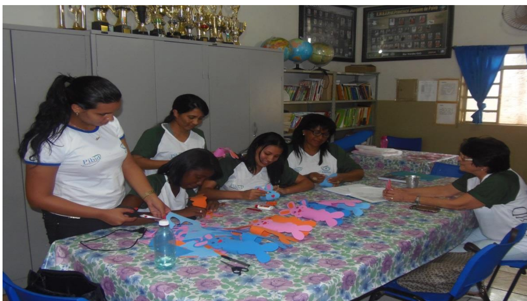
Figura 14. Professora Supervisora da EMEF Professor Francisco Joaquim de Paiva, Coordenadora da área de Pedagogia e Licenciandas desenvolvendo workshop para preparo da comemoração do dia da Páscoa