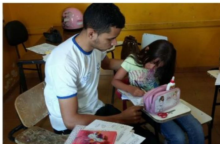
Figura 24. Diferentes momentos dos pibidianos da área da Pedagogia, da equipe da EMEF Professor Luiz Alberto Leão, em atividades práticas nas salas de aula atendendo os alunos no reforço escolar