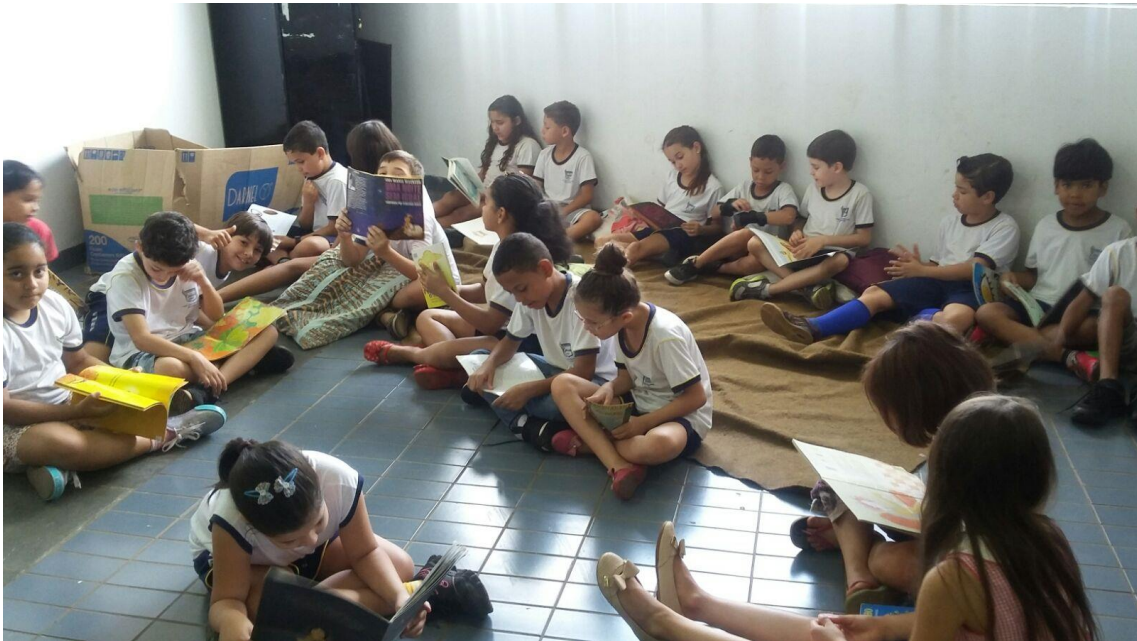
Figura 32. Projeto Leitura uma aventura que encanta da EMEF Luiz Alberto Leão