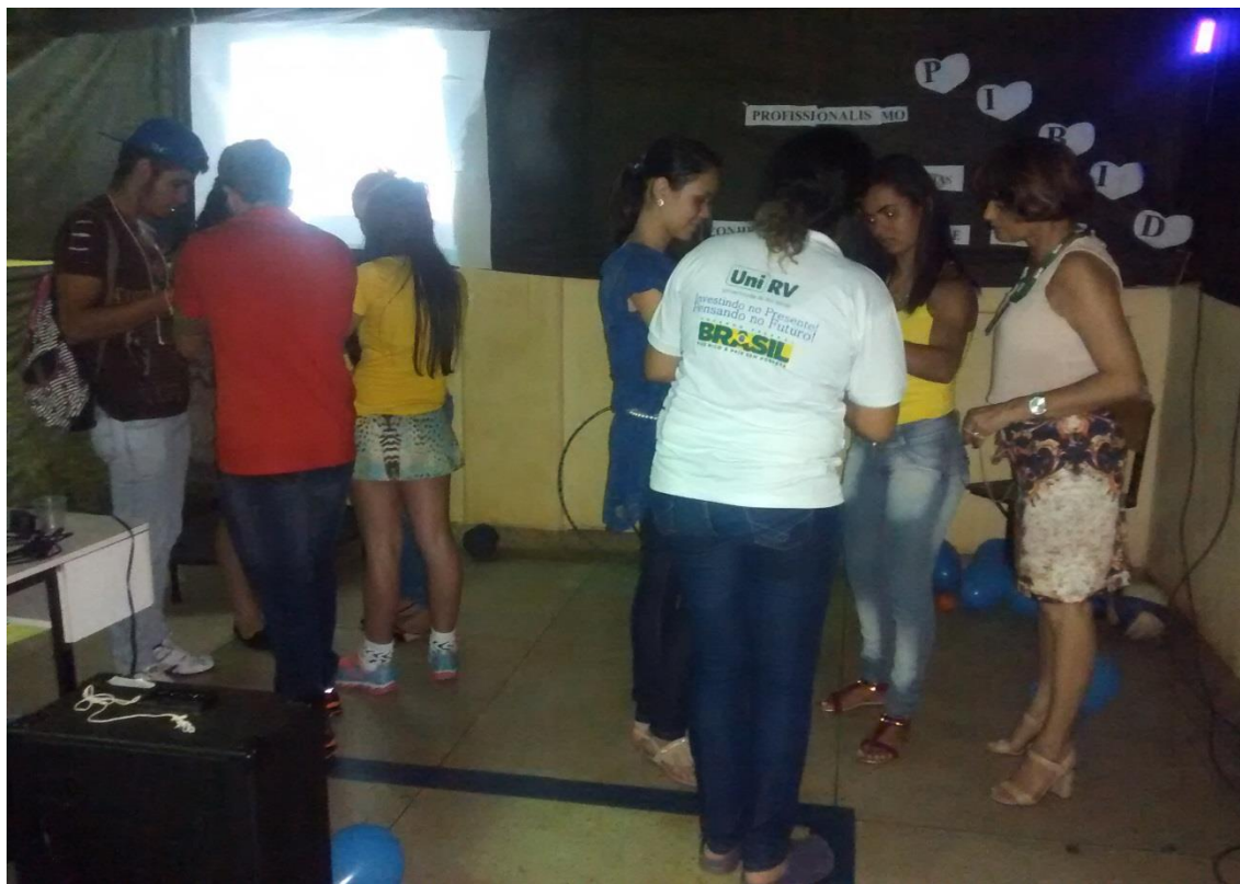
Figura 49. Exposição e divulgação na IES dos trabalhos realizados pelos bolsistas, da área da Educação Física, nas escolas parceiras.

Atividade 28-m. Organizar e executar evento para socializar os conhecimentos adquiridos no Pibid/2015 para motivar outros acadêmicos da Educação Física a participar do Programa.