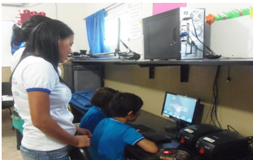
Figura 55. Acadêmica pibidiana aplicando softwares educativos no laboratório de informática da EMEF Prof. Francisco Joaquim de Paiva