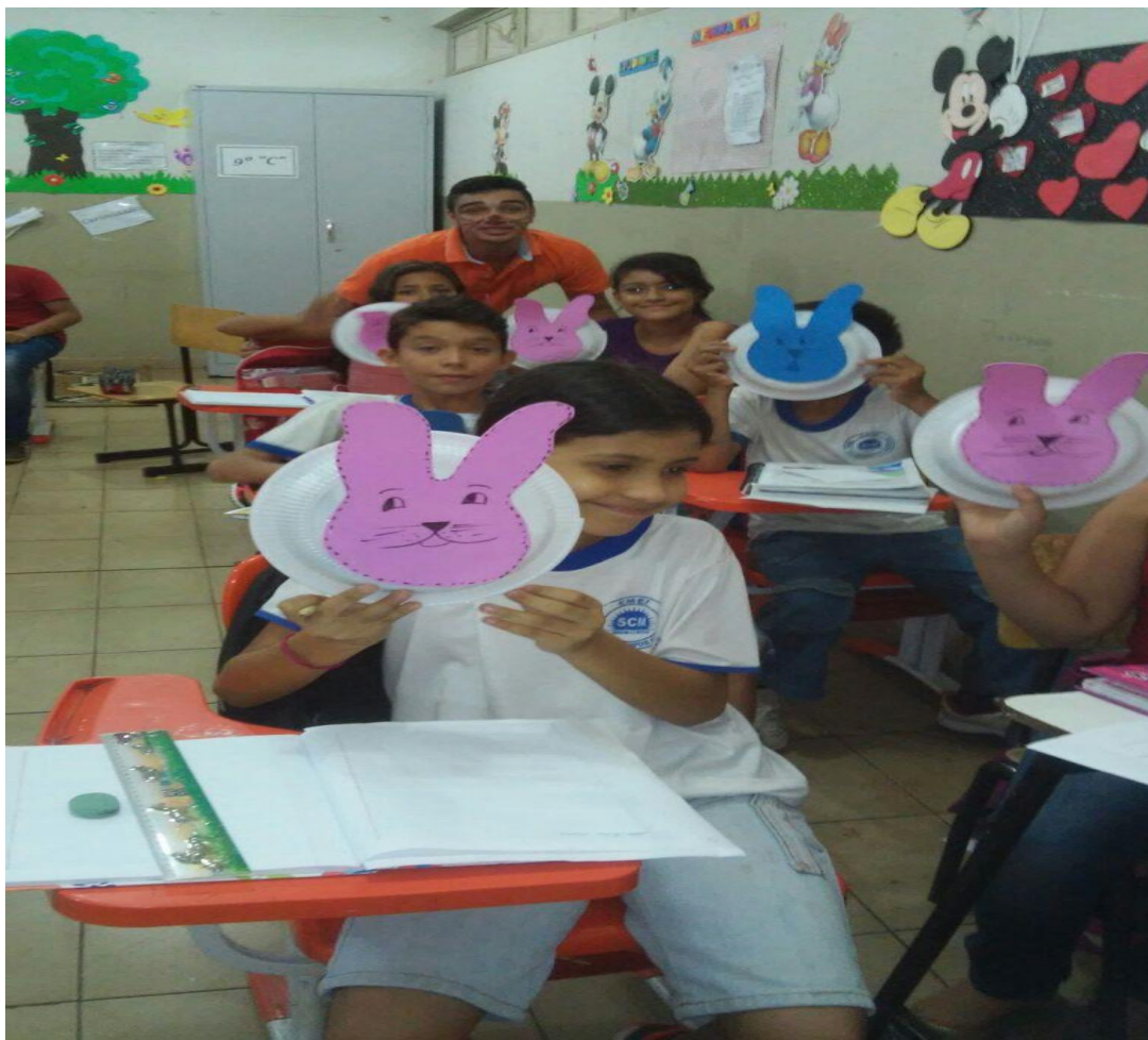
Figura 13. PIBIDIANOS e professoras regentes da EMEF Professora Selva Campos Monteiro em atividade prática na sala de aula em comemoração ao dia da Páscoa