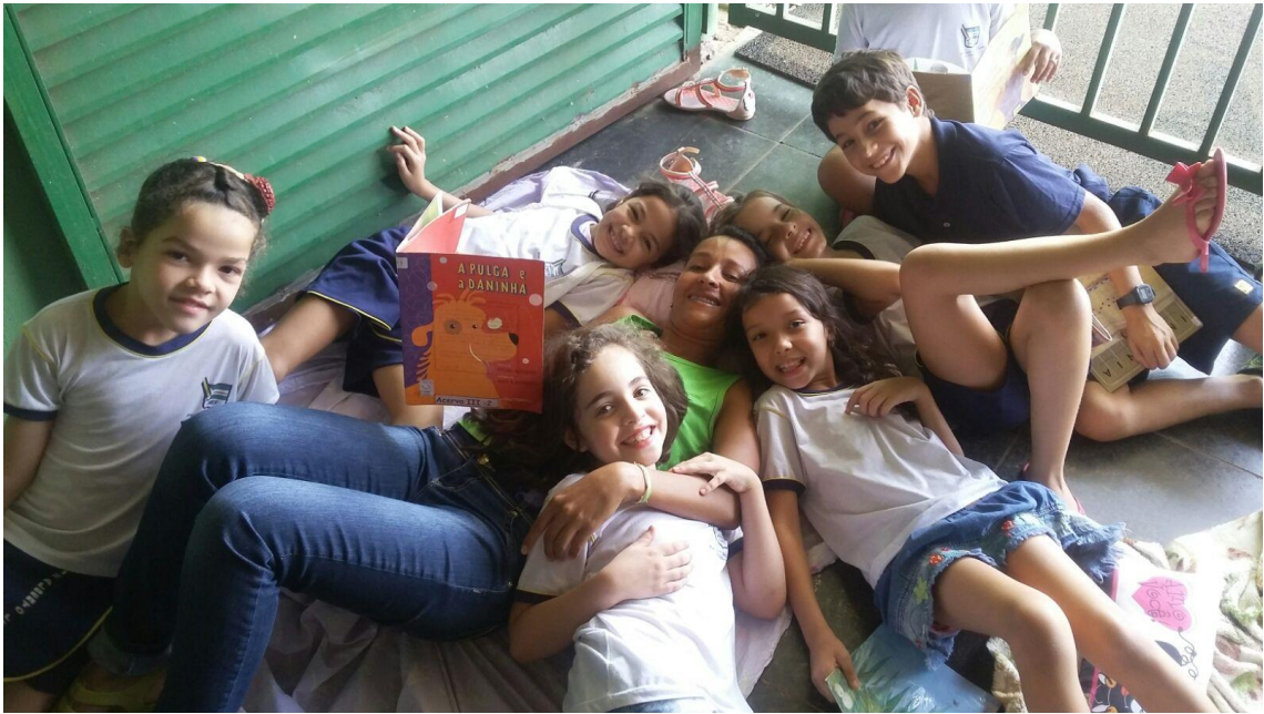
Figura 33. Projeto Leitura uma aventura que encanta foi criado e executado pelas pibidianas através da sequência didática