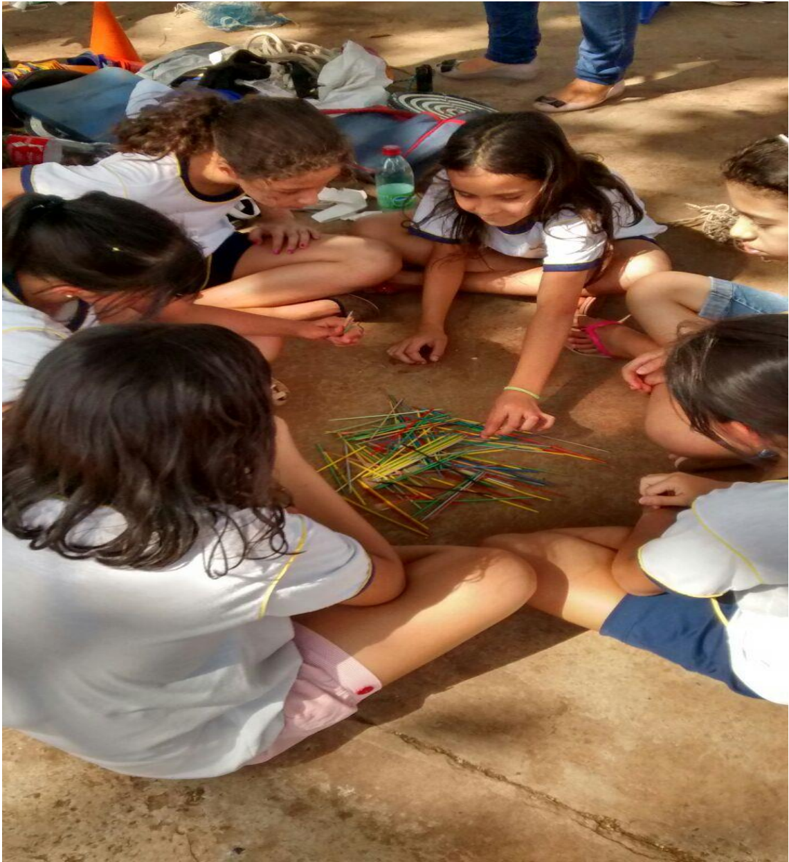
Figura 41. Crianças brincando na praça na hora do recreio