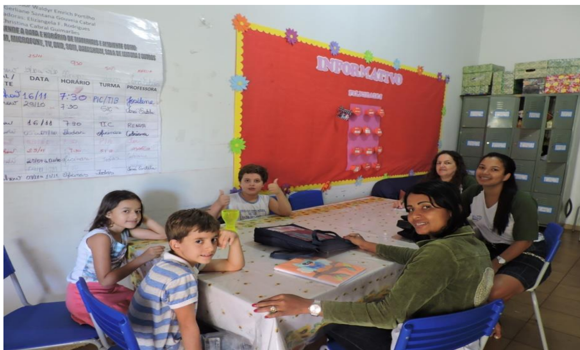
Figura 43. Pibidianas reunidas com a chapa vencedora do Grêmio Estudantil da EMEFTI Prof. Waldyr Emrich Portilho

Atividade 23 – j. Participar do 2.º Encontro de Licenciaturas do sudoeste goiano e 2.º Encontro do PIBID do sudoeste goiano, UF-Jataí-GO para socializar os resultados alcançados pelo PIBID/FESURV 2015 e trocar experiências com as demais instituições promotoras.