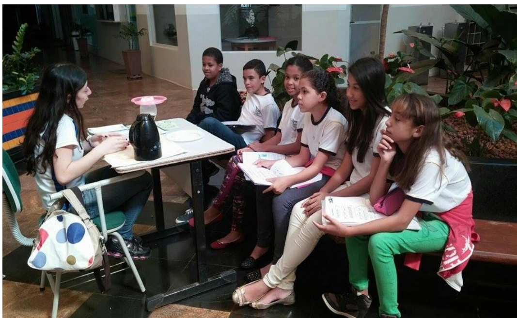
Figura 57. Pibidiana em atividade prática no pátio da EMEF Prof. Luiz Alberto Leão