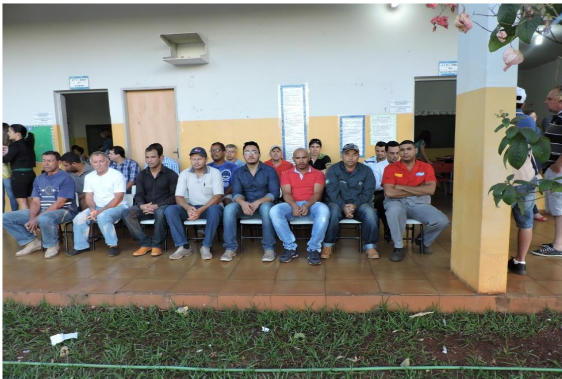
Figura 10 – Presença dos pais das crianças da EMEFTI Prof. Waldyr Emerich Portilho em comemoração ao seu dia