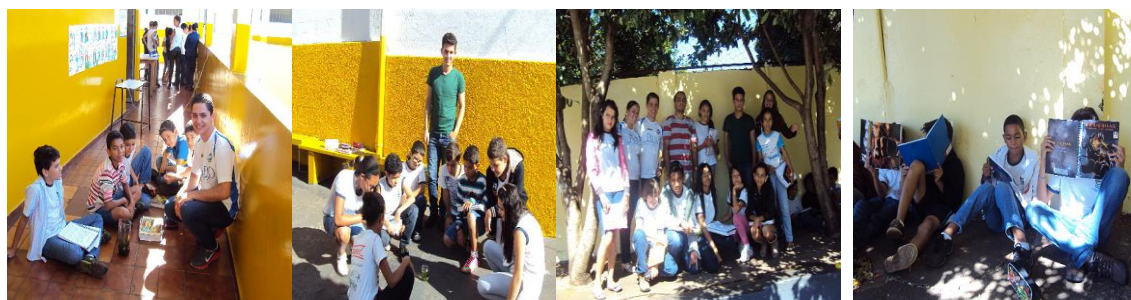
Figura 52. Gincana sobre o conhecimento entre os alunos da EMEF Prof. Luiz Alberto Leão. O projeto foi executado de forma interdisciplinar entre as áreas de ciências, português, história e geografia.