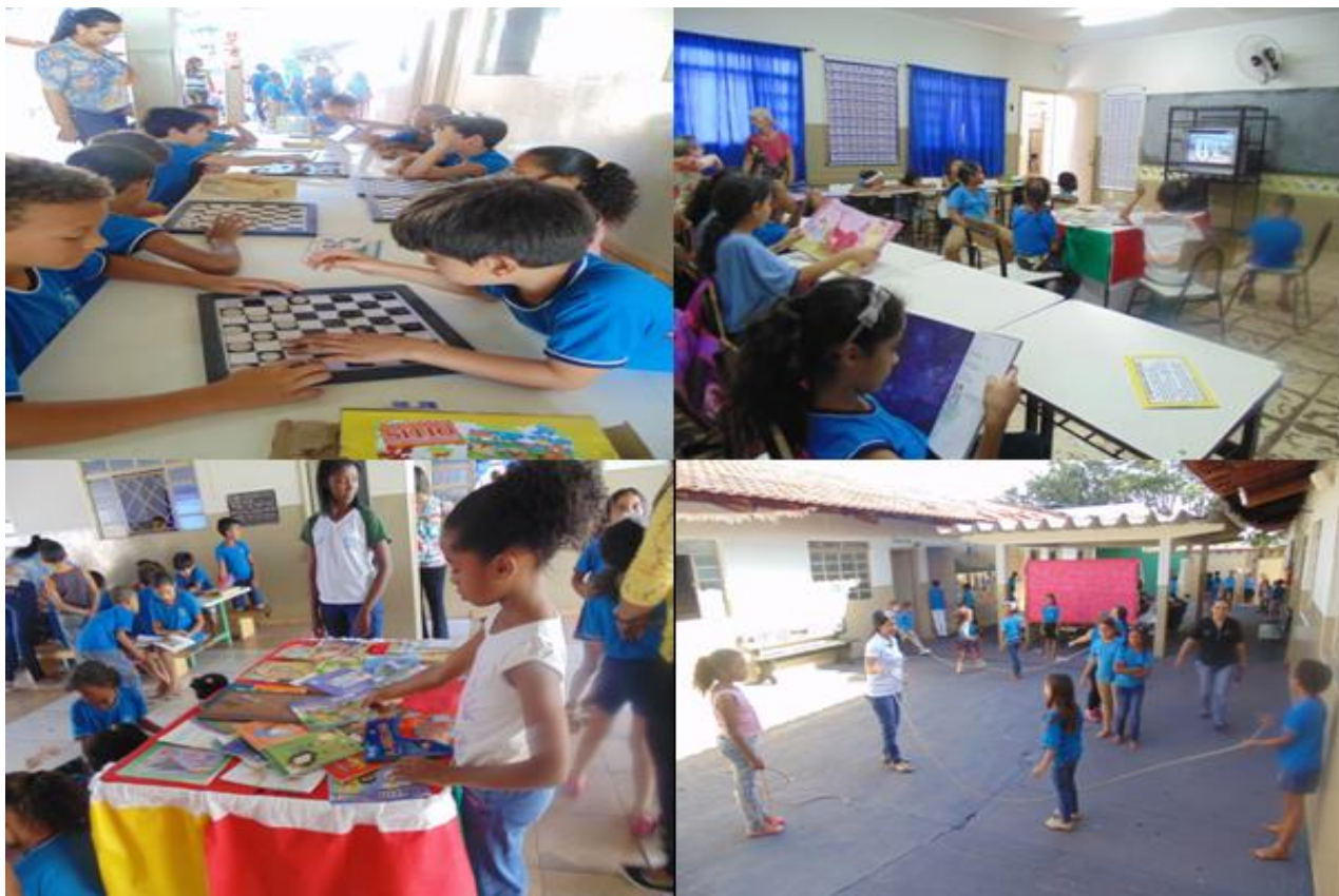
Figura 39. Jogos, leitura, filmes e brincadeiras executados pelos pibidianos durante o recreio na EMEF Prof. Francisco Joaquim de Paiva.