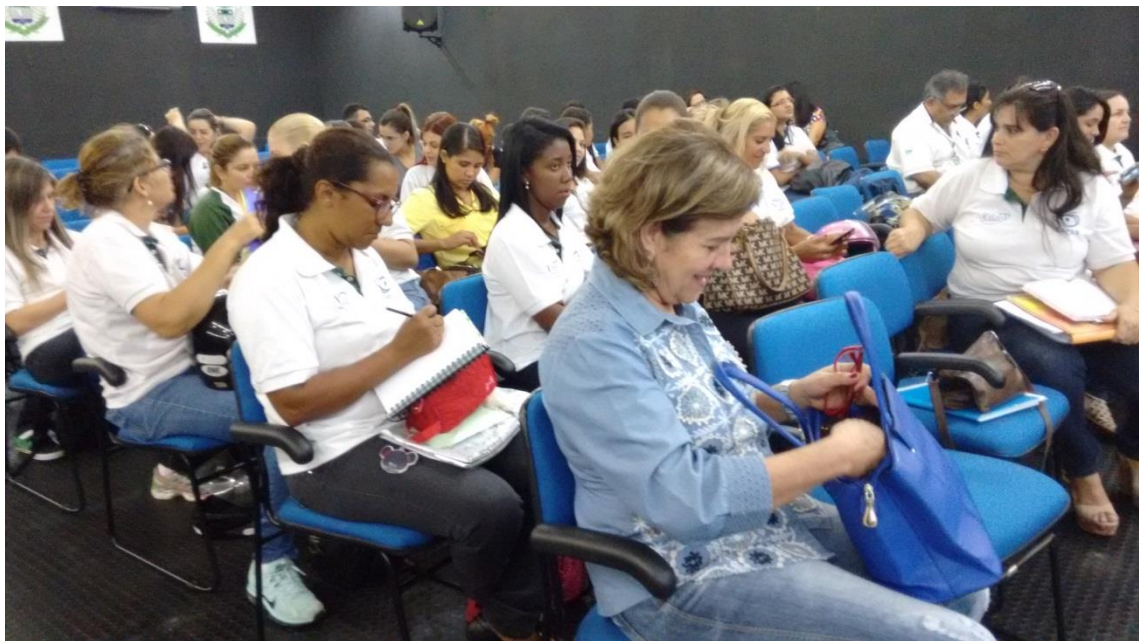
Figura 6. Reunião no auditório do Centro Administrativo da IES entre todos os bolsistas do Pibid, Pró-reitora da Graduação e representante da Secretaria Municipal de Educação de Rio Verde para a apresentação das atividades executadas no ano de 2015 e os Planos de trabalho de 2016.