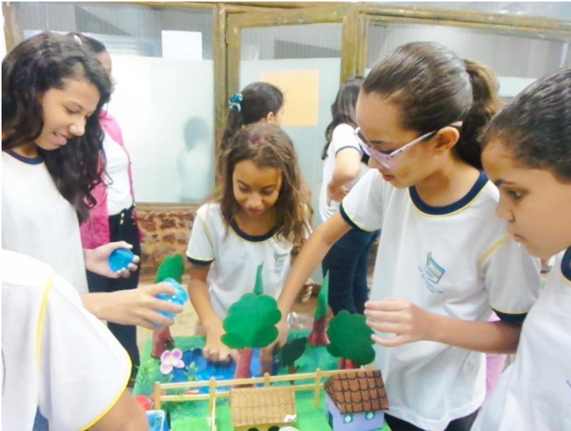
Figura 58. Alunos da EMEF Prof. Luiz Alberto Leão explorando a maquete denominada Caminho das águas.

Atividade 40-q. Instrumentalizar os licenciandos para utilização dos recursos didáticos disponíveis no LIFE a fim de incluí-los nas práticas pedagógicas das escolas.