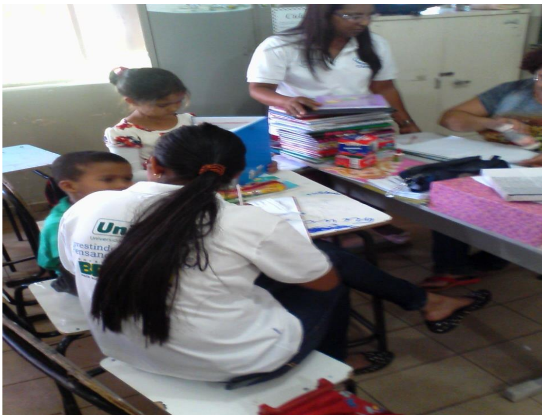
Figuras 17 e 18. PIBIDiana e professora supervisora da EMEF Professora Selva Campos Monteiro nas atividades práticas do reforço

Atividade 10 – c . Em todas as escolas parceiras foram criados projetos de reforço e monitoria e executados pelos pibidianos e professoras regentes e supervisores, sob coordenação dos professores da IES.