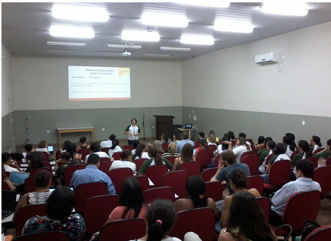
Figura 45. Todos os bolsistas Pibid reunidos no auditório do Centro de Negócios da UniRV para aprender a elaborar resumo expandido e relato de experiência.

Atividade 25 – K Proporcionar capacitação aos bolsistas para auxiliá-los na elaboração e apresentação de trabalhos científicos.