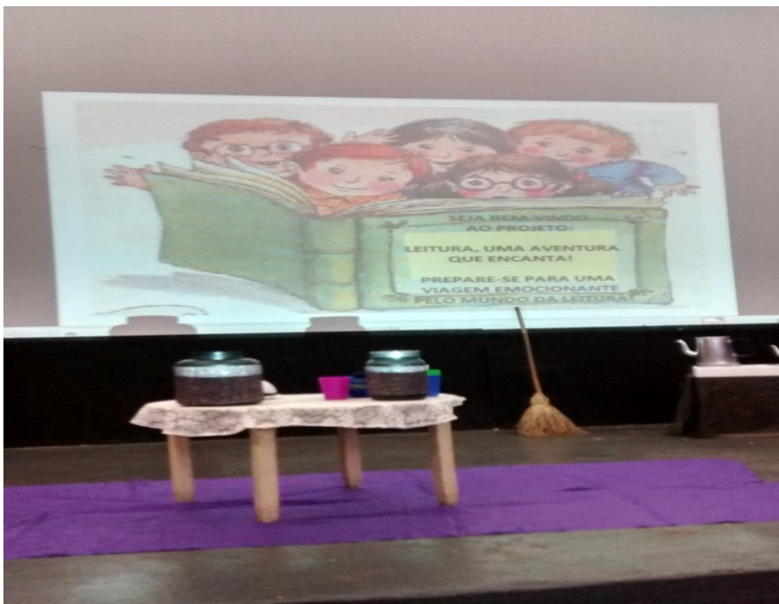
Figura 30. Cenário preparado pelas pibidianas para apresentação de peças teatrais na EMEF Luiz Alberto Leão, no encerramento do Projeto sobre Leitura

Atividade 14-f. Criar e implementar o Projeto Leitura uma aventura que encanta buscando atrair os alunos para o universo da literatura visando formar bons leitores.