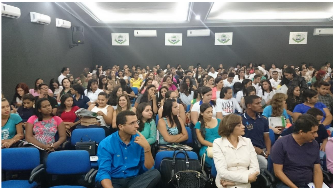
Figura 47. Auditório do Centro Administrativo da UniRV com lotação completa de participantes na abertura do III Encontro Pibid, da UniRV. Foram aprovados 89 trabalhos e apresentados nas modalidades de comunicação oral, pôsteres e oficinas.

Atividade 26-I. Organizar e participar do III Encontro do PIBID da UniRV- Formação docente: tessitura dos saberes profissionais na práxis - para socializar os resultados das atividades trabalhadas e trocar experiências com participantes de outras instituições.