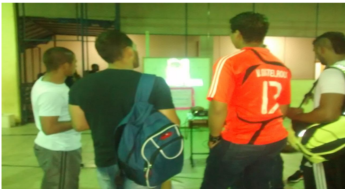
Figura 50. Acadêmicos em visita ao evento do Pibid da área da Educação Física