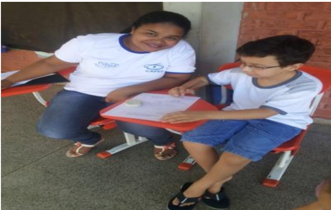
Figuras 19 e 20. Pibidianas da Pedagogia em atividade do reforço na EMFETI Waldyr Emrich Portilho, nos casos que necessitavam de atendimento individualizado aos alunos