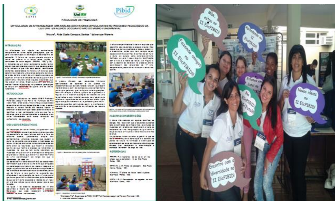
Figura 44. Imagens das acadêmicas e professora supervisora da EMEF Prof. Francisco Joaquim de Paiva e um dos trabalhos apresentado no evento.

Atividade 23 – j. Participar do 2.º Encontro de Licenciaturas do sudoeste goiano e 2.º Encontro do PIBID do sudoeste goiano, UF-Jataí-GO para socializar os resultados alcançados pelo PIBID/FESURV 2015 e trocar experiências com as demais instituições promotoras.