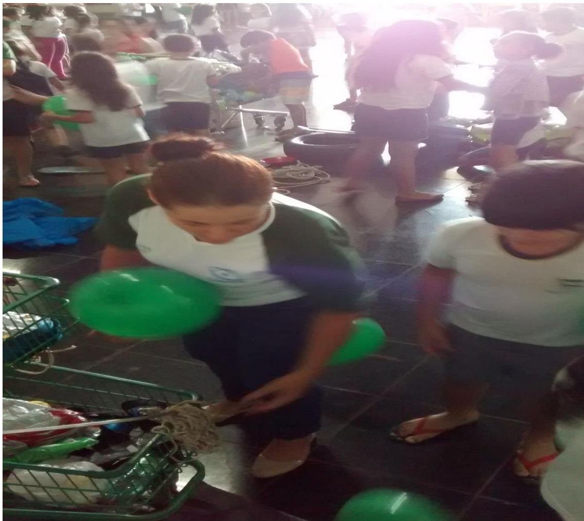
Figura 42. Pibidiana distribuindo os recursos didático-pedagógicos para serem utilizados na hora do recreio no pátio da EMEF Prof. Luiz Alberto Leão