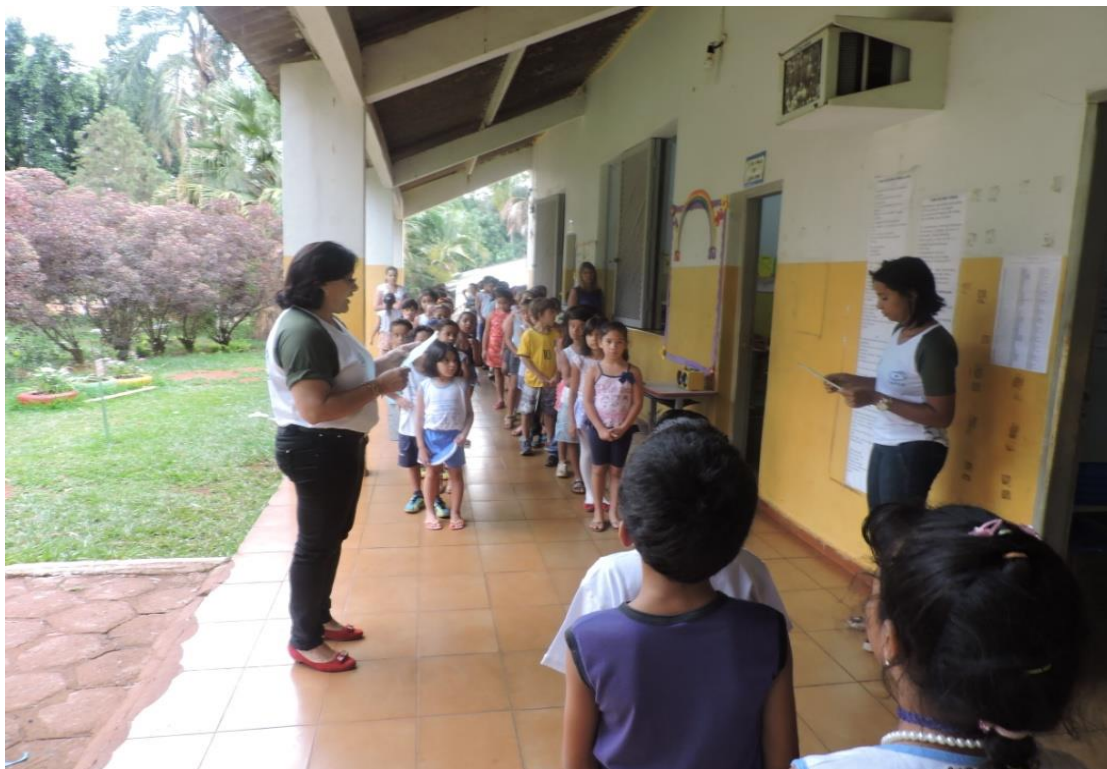
Figura 12. Pibidianas e crianças da EMEFTI Prof. Waldyr Emerich Portilho participando das Comemorações do Dia do Professor