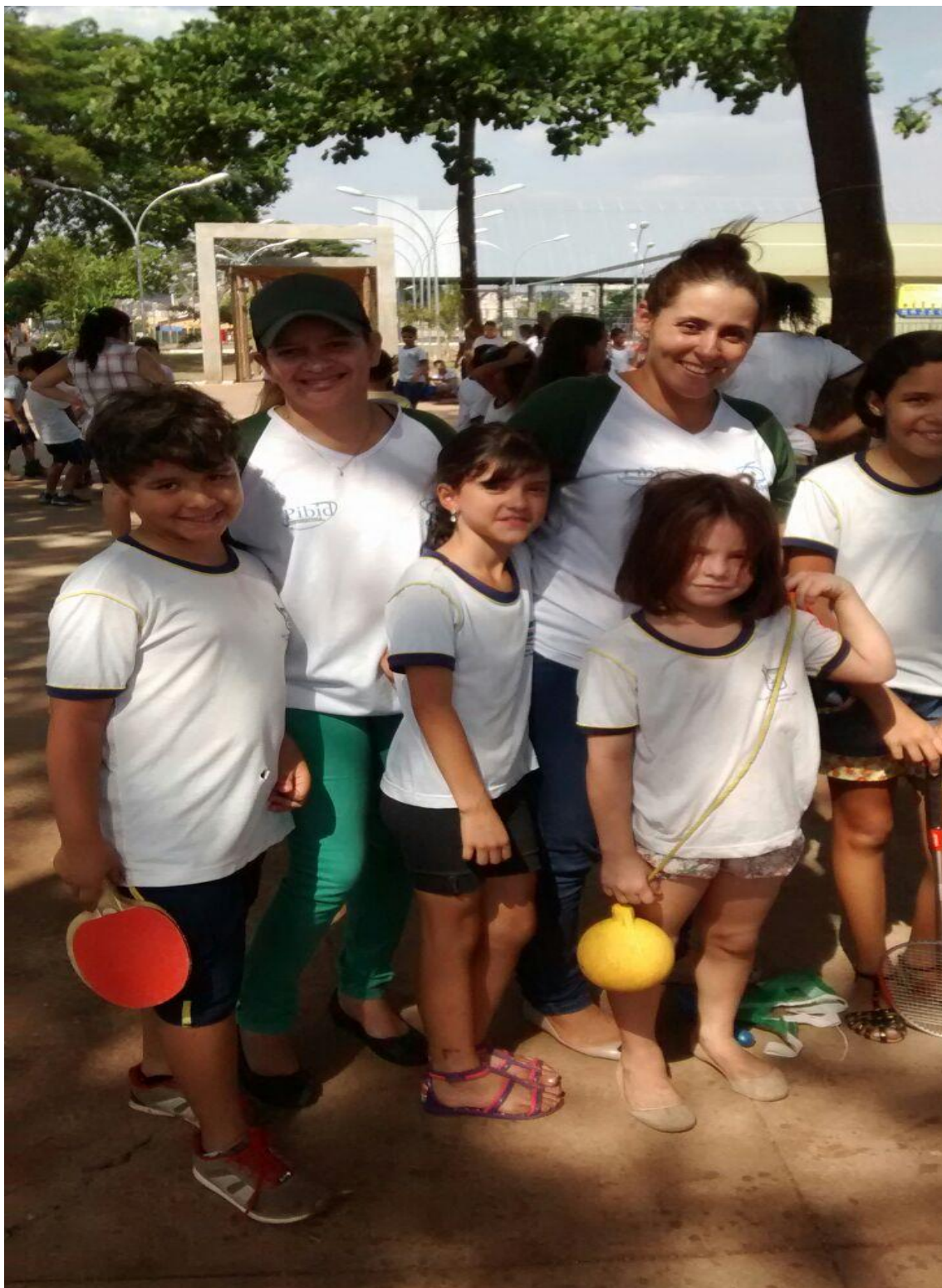
Figuras 40 e 41. Mostram as atividades práticas desenvolvidas, durante o recreio da EMEF Luiz Alberto Leão, em praças públicas da cidade de Rio Verde