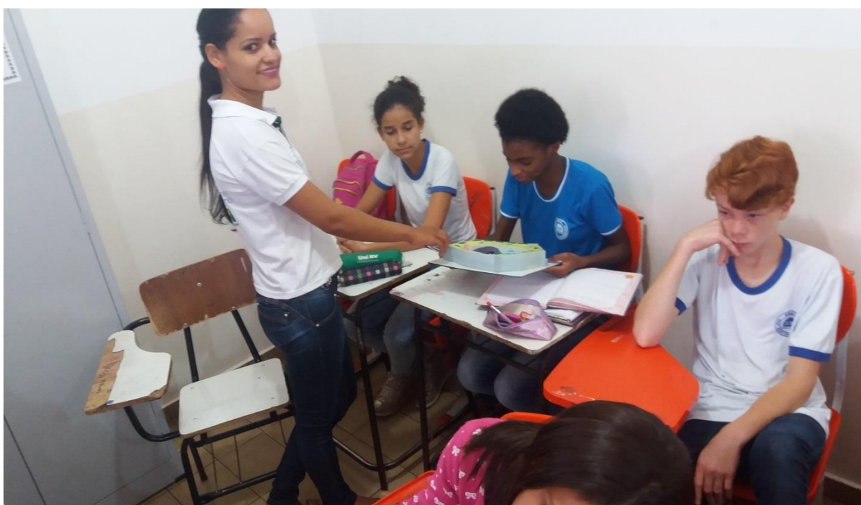
Figura 21. Pibidianas da área de Ciências atuando na prática da monitoria junto aos alunos da escola parceira EMEF Professora Selva Campos Monteiro e Figura 22., abaixo, na EMEF Domingos Moni