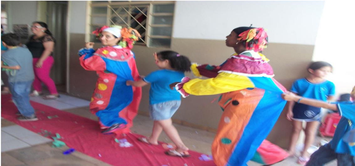
Figura 7 – As pibidianas participando do carnaval/ 2015 junto com os alunos e professores da EMEF Prof. Francisco Joaquim de Paiva

Atividade 6–b Algumas imagens sobre datas comemorativas desenvolvidas pelos pibidianos nas escolas parceiras