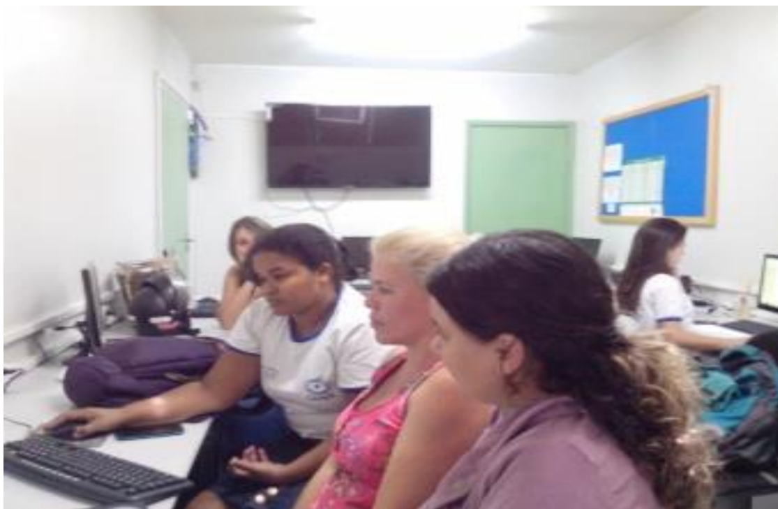
Figuras 53. Pibidianas da área da Pedagogia, da equipe da EMEF Prof. Maria Brígida da Fonseca aprendendo a utilizar softwares educativos no espaço Life

Atividade 35 - o. Realizar oficina sobre a instalação e uso de softwares educativos para auxiliar no processo ensino e aprendizagem