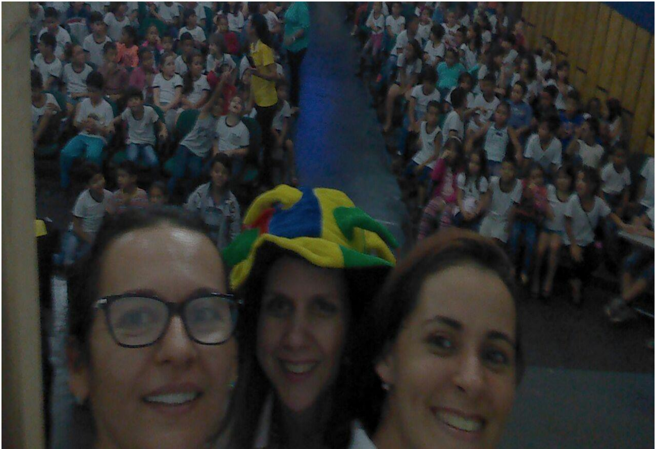
Figura 31. Em primeiro plano as pibidianas da área da Pedagogia e a professora supervisora na apresentação de peça teatral a todos os alunos da EMEF Luiz Alberto Leão