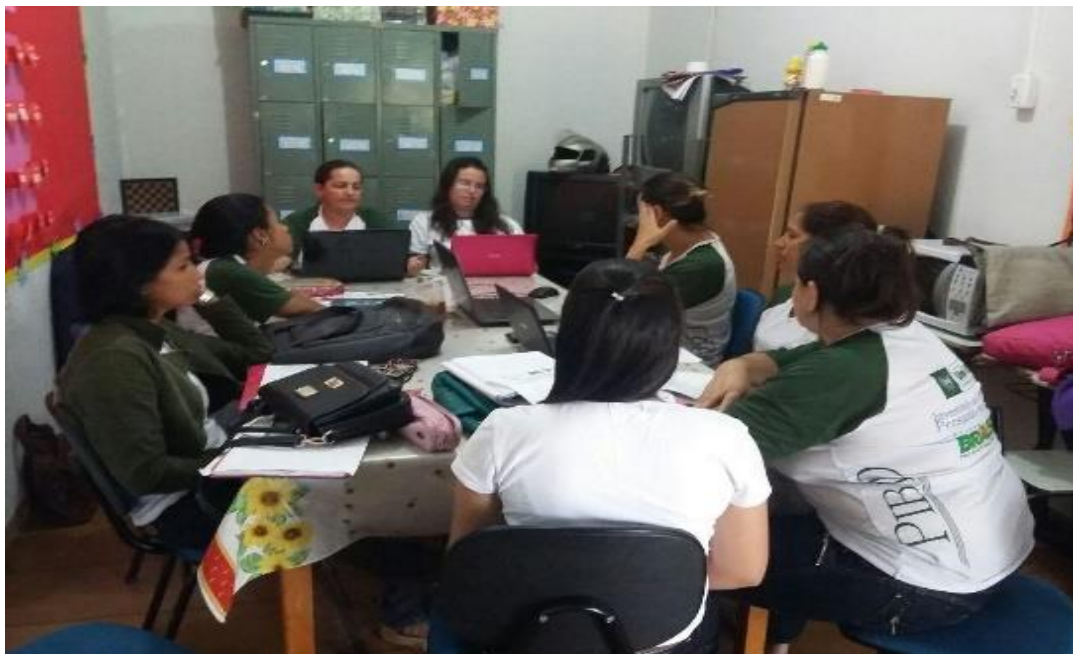
Figura 1. Licenciandos e professora supervisora reunidos na EMEFTI Prof. Waldyr Emrich Portilho

Atividade 3-A: Reuniões realizadas nas escolas municipais, LIFE e na IES, entre os acadêmicos, professores supervisores e coordenadores do Pibid para (re) planejamento, avaliação e (re) elaboração dos projetos a serem executados.