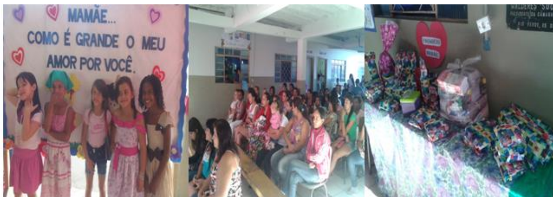
Figura 15. Diferentes imagens da comemoração do Dia das Mães promovida pelos PIBIDIANOS e professores regentes da EMEF Professor Francisco Joaquim de Paiva