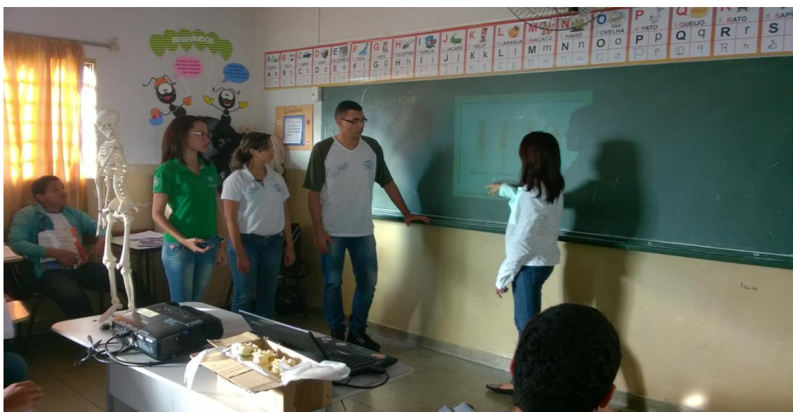
Figura 61. PIBIDianos da área de Ciências em atividade prática na EMEF Domingos Moni

Atividade 46-s. Elaborar e executar o Projeto sobre a reprodução humana para os alunos compreenderem o seu funcionamento. O projeto foi executado em todas as escolas parceiras.