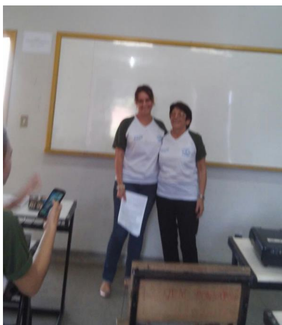
Figura 46. As coordenadoras da área da Pedagogia ministraram, nas dependências da IES, um minicurso sobre a elaboração, apresentação e publicação de trabalhos acadêmicos.