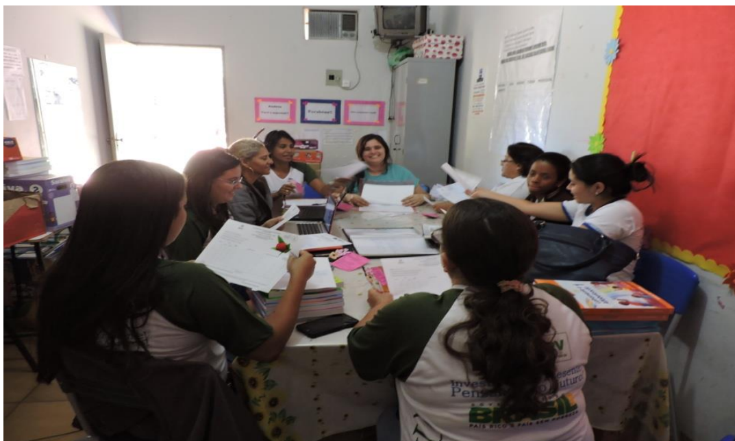
Figura 35. Todas as escolas parceiras realizaram reuniões para criar e executar os planos para o aprimoramento do ensino da matemática. Equipe da EMEFTI Prof. Waldyr Emrich Portilho

Atividade 15-g. Reunir acadêmicos, professores supervisores e coordenadores do Pibid para planejamento e elaboração dos projetos sobre o processo e ensino da aprendizagem da disciplina matemática.