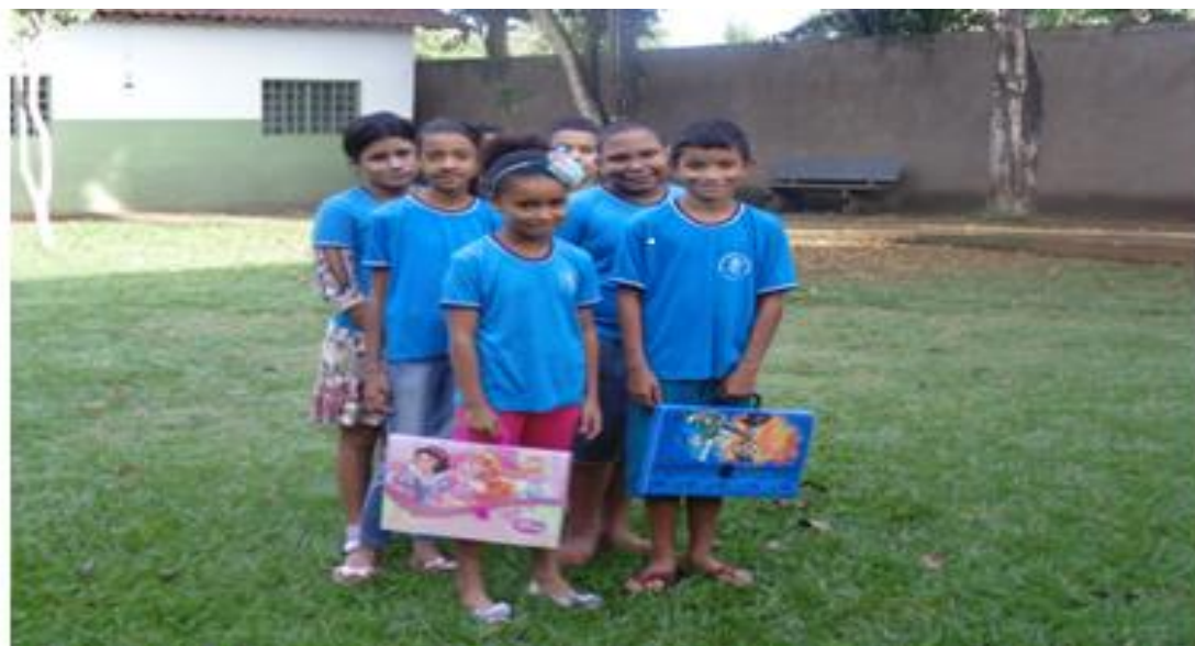
Figura 25. Mostra parte das crianças envolvidas no projeto Maleta Mágica, criado e executado pela equipe do Pibid da EMEF Professor Francisco Joaquim de Paiva

Atividade 12-d. Implementar o Projeto Maleta Mágica para incentivar a leitura e valorizar a cultura nacional por meio do tema folclore. Este último tema foi executado em todas as escolas parceiras, onde foi realizada a sequência didática resgatando a cultura popular, o folclore, de acordo com o ano, a necessidade e a realidade de cada sala de aula.