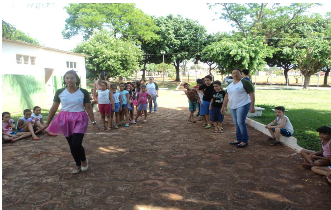
Figura 11 – PIBidianas e professora supervisora desenvolvendo atividades em comemoração ao dia da criança na EMEFTI Prof. Waldyr Emerich Portilho