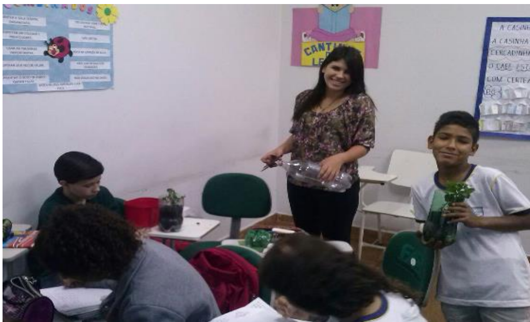
Figura 56. Pibidiana em atividade prática na EMEF Prof. Luiz Alberto Leão

Atividade 38-p. Criar e executar o Projeto Água para os seres vivos para conscientizar os alunos sobre o uso da água. As Figuras 56 e 57 mostram momentos da execução do projeto.