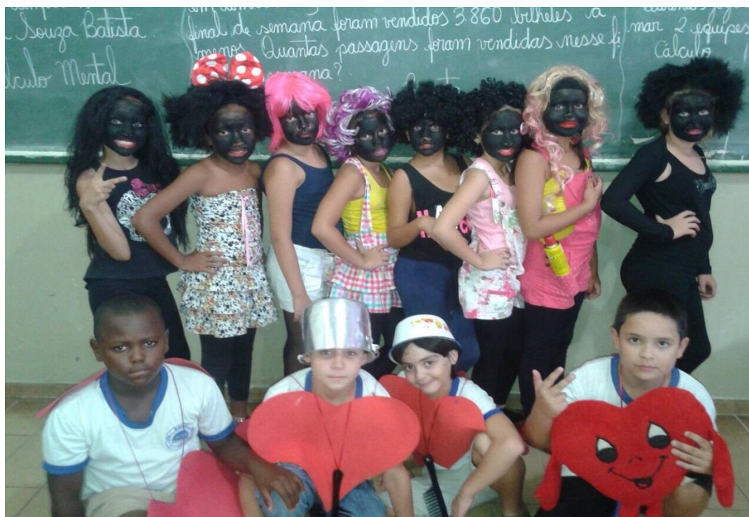
Figura 51. Equipe vencedora da EMEF Prof. Selva Campos Monteiro. Disputa de caracterização sobre o tema etnia e discriminação executada pelos pibidianos da área de Ciências e Pedagogia

Atividade 33-n. Executar Gincanas e olimpíadas de conhecimento para aprimoramento da aprendizagem das crianças.