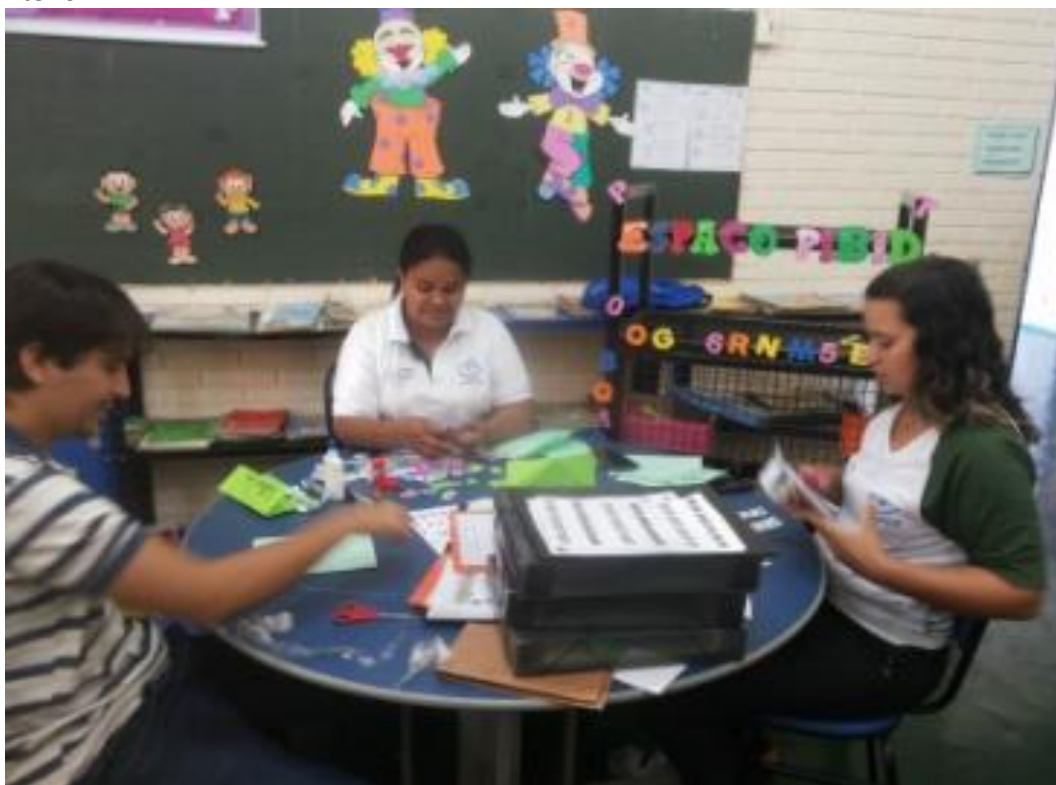
Figura 37. PIBIDianos da equipe da EMEF Prof. Maria Brígida da Fonseca criando materiais didáticos pedagógicos concretos para facilitar o processo ensino aprendizagem da matemática

Atividade 17 – h. Implementar Projetos sobre a hora do recreio para minimizar as agressões entre as crianças, cultivar o respeito às regras, a si e ao outro. Diferentes projetos foram criados e executados nas escolas parceiras.