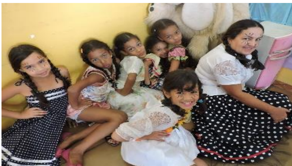
Figuras 27 e 28. Pibidianas e crianças da EMEFTI Professor Waldyr Emrich Portilho com apresentações de encerramento do Projeto sobre Folclore. As atividades foram desenvolvidas por meio da sequência didática resgatando a cultura popular, o folclore, de acordo com o ano, a necessidade e a realidade de cada sala de aula.